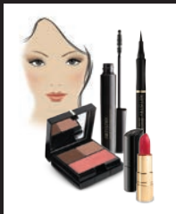
MEDIUM 11-9365 MEDIANO 11-9365 TONS MOYENS 11-9365