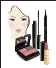
LIGHT 11-9364 CLARO 11-9364 TONS PÂLES 11-9364

Trois collections de couleurs savamment mises au point pour toutes les femmes: