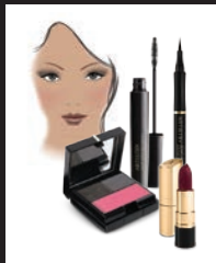
DARK 11-9366 OSCURO 11-9366 TONS FONCÉS 11-9366